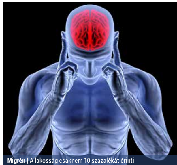
Migrén | A lakosság csaknem 10 százalékát érinti

A migrén rohamokban jelentkező heves fejfájás, visszatérő, lüktető, nagyfokú fájdalom, amely többnyire a fej egyik oldalát érinti. A hirtelen kezdődő fájdalmat látási, hallási vagy egyéb idegrendszeri tünetek előzik meg. A roham általában havonta néhány alkalommal jelentkezik, viszont több napig is tarthat.