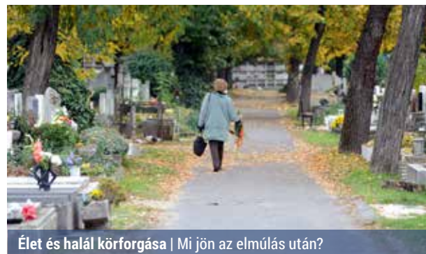
Élet és halál körforgása | Mi jön az elmúlás után?

A média a halál különböző formáit tárja elénk nap mint nap. Elfogadni és megérteni az elmúlást azonban korántsem könnyű. A történelmi korokban nagy jelentőséget tulajdonítottak a gyász rítusának, majd széppel és szívrázzal a halál után. Ma azonban úgy keresi a választ az elmúlás kérdéseire.