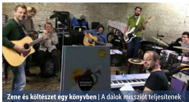
Zene és költészet egy könyvben | A dalok missziót teljesítenek

A középkori trubadúrok megjelenése óta elfogadott, hogy a költők énekelnek, az énekesek pedig dalszövegeket írnak. A kortárs magyar irodalmi és zenei világ egyik legizgalmasabb kísérlete a Rájátszás műhelymunka, mely 2011 óta működik, és már a második kötet (és vele együtt egy cédé az új dalokkal) jelenik meg. Az egykor a Margó fesztiválra összehozott művészek nem véletlenül maradtak együtt az elmúlt években. Hatalmas közönségért aratnak minden fellépésükön, és ők maguk is élvezik ezt az újfajta alkotási folyamatot.