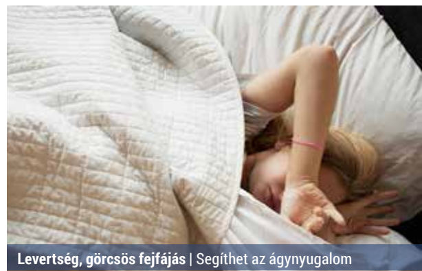
Levertség, görcsös fejfájás | Segíthet az ágynyugalom

A fejfájás elmúltával erőteljes fáradtságérzés jelentkezik, amely azonban egyre csökken, és hamarosan a szokott egészségi állapotába tér vissza a beteg. A hatékony kezeléshez elengedhetetlenül szükséges a diagnózis pontos felállítása, valamint a társbetegségek ismerete, ezért mindenképp érdemes szakorvoshoz fordulni. Részletek hazipatika.com oldalon. (béres)