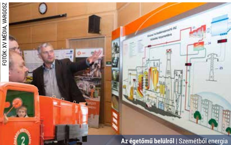
Az égetőmű belülről | Szemétből energia

Két Szemléletformáló és Újrahasználati Központ épül uniós forrásból a fővárosban, az egyik a Fővárosi Közterület-fenntartó (FKF) Zrt. égisze alatt működő rákospalotai hulladékhasznosító mű (HUHA) területén, a másik a XVIII. kerületben.