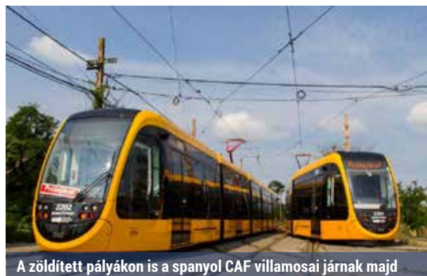
A zöldített pályákon is a spanyol CAF villamosai járnak majd