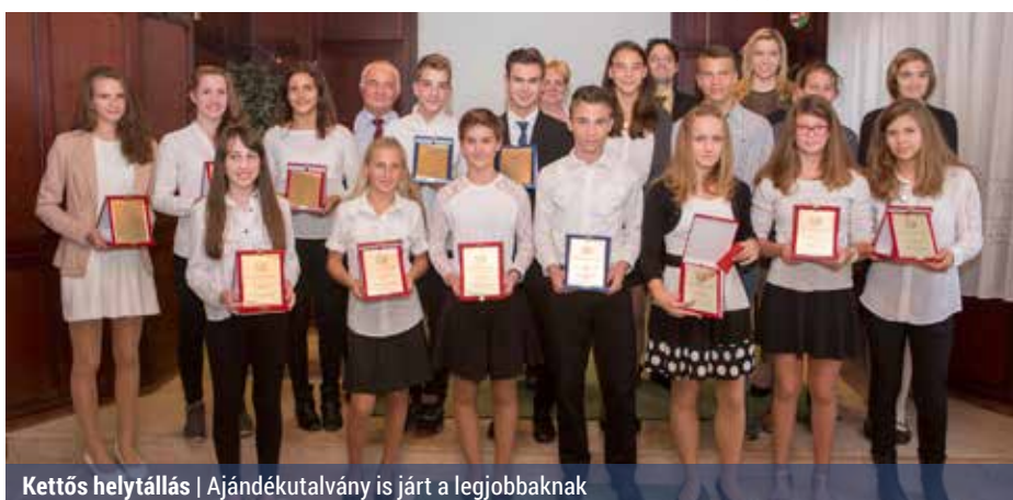
Kettős helytállás | Ajándékutalvány is járt a legjobbaknak

A 2014/15-ös tanévben elért tanulmányi és sporteredményeik alapján az önkormányzat tizennyolc fiatal részesített „Élen a tanulásban, élen a sportban” díjban. Idén – a díjátadás 19 éves történetében első ízben – a pályázók az emléklapok mellett ajándékutalványt is kaptak. Az 5–8. évfolyamon egyszeri 10 ezer forint, a 9–13. évfolyamon pedig egyszeri 15