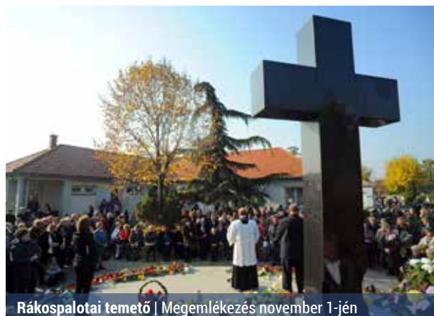
Rákospalotai temető | Megemlékezés november 1-jén

Idén a halottak napi ünnepek több napra oszlik, így várhatóan a temetőkben a legforgalmasabb napok október 30., péntek, október 31., szombat és november 1., vasárnap lesznek – tájékoztatott a Budapesti Temetkezési Intézet (BTI). A Rákospalotai temetőben november 1-jén délután 1 órakor halottak napi megemlékezést tartanak.