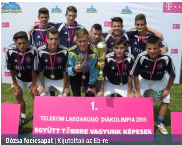
Dózsa focicsapat | Kijutottak az Eb-re

– Ezek a hetek a szponzorok, támogatók felkutatásáról szólnak, utána pedig a csapatépítésen lesz a hangsúly. Szerencsére bővelkedünk „profik” labdarúgókból, akik képesek lehetnek ilyen volumenű feladatot megoldására is – vallja a testnevelő tanár. R. T.