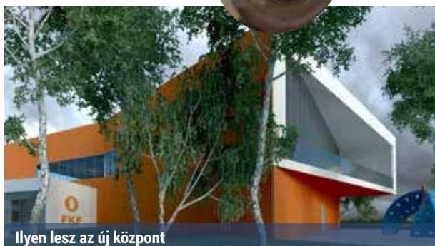
Ilyen lesz az új központ