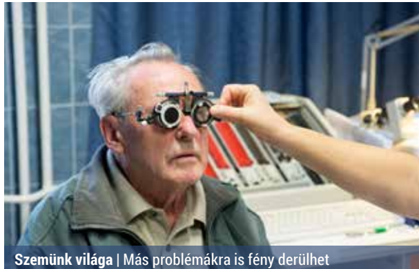
Szemünk világa | Más problémákra is fény derülhet

vetség és az optikai szakma által közösen szervezett Látás Hónapja kampány célja a rendszeres látásvizsgálaton való részvétel fontosságára való figyelemfelhívás. Az öszszefogás keretében a magyar lakosság októberben térítésmentes látásellenőrzésen, szakmai tanácsadáson vehet részt, ha felkeresi a kampányban részt vevő valamelyik üzletet.