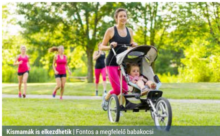
Kismamák is elkezdhetik | Fontos a megfelelő babakocsi

Külföldön már régóta, hazánkban pár éve láthatunk egyre több babakocsival futó anyukát. A megoldás ideális azoknak, akik terhességük alatt is aktívan sportoltak, és a szülés utáni időszakban sem akarnak lemondani a mozgásról. Igazából nem is kell más hozzá, csupán futásra alkalmas babakocsi, lehetőség szerint néhány társ, valamint étel, ital és játék a kicsinek.