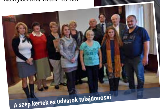
A szép kertek és udvarok tulajdonosai