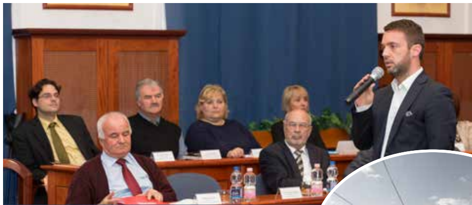
Lakossági tájékoztató | A városvezetés ismertette a részleteket