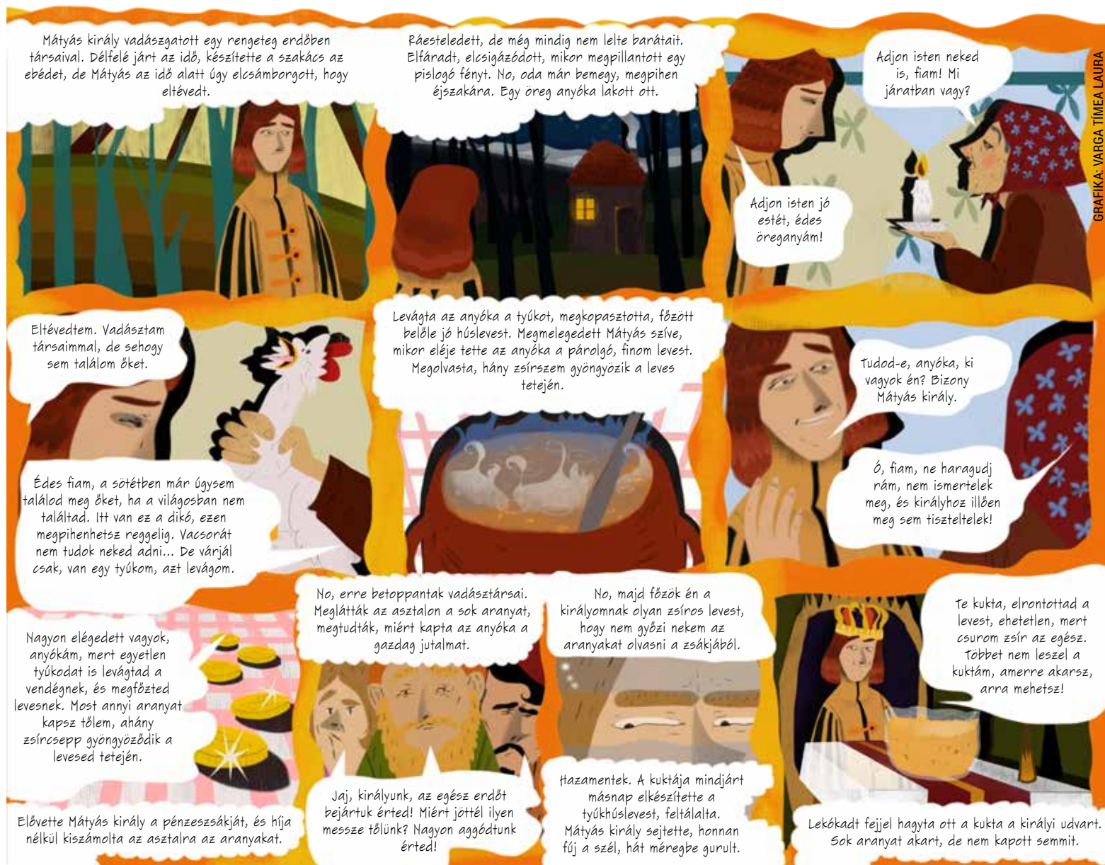
GRAFIKA: VARGA TÍMEA LAURA

Fejtsd meg a rejtvényt és az üzenetet! Vágd ki az újságból, és küldd el zárt borítékban levelezési címünkre (XV Média Kft., 1615 Bp., Pf. 155) vagy add le a szerkesztőség részére a Bocskai utca 1-3. szám alatt. A borítékra írd rá „Dörmi FEJTVÉNY”. A helyes megfejtőink közül egy a Dörmi fejtvény legújabb számát nyeri. A beküldési határidő: 2015. október 28.