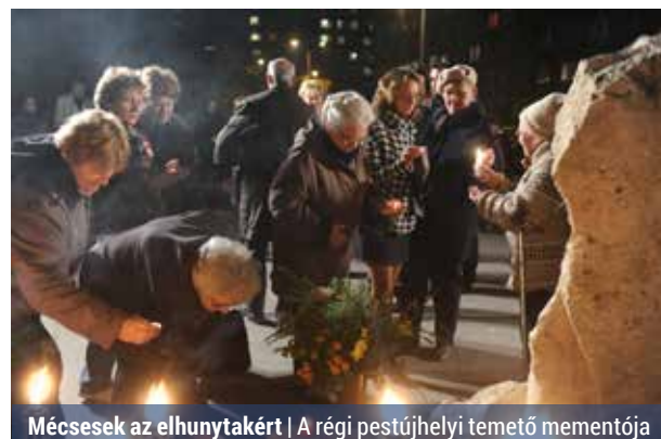
Mécsesek az elhunytakért | A régi pestújhelyi temető mementója

Gyertyagyújtással emlékezhetünk november 1-jén Pestújhely egykori polgáira a régi pestújhelyi temető helyén, a Hartyán közben felállított Memento emlékműnél. A szervező Pestújhelyi Pátria Egyesület délután 6 órára várja az érdeklődőket a megem-