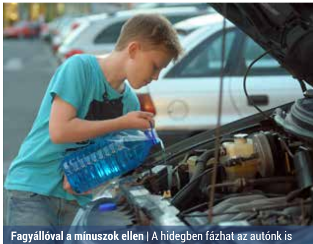
Fagyállóval a mínuszok ellen | A hidegben fázhat az autónk is

A folyadékfagyáspontot a benzinkutaknál ingyenesen megméri. Ha nem éri el a mínusz 20-25 Celsius-fokot, akkor a motortérben található tágulási tartályba be kell tölteni fagyálló hűtőfolyadékot. Ha ez kevés a minimális védelemhez, akkor a blokkból ki kell eresztetni a hűtővizet, majd ezt a tágulási tartályon keresztül pótolni. Ezt a műveletet azonban inkább bízzuk szerelőre.