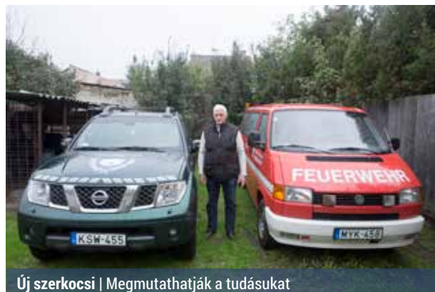
Új szerkocsi | Megmutathatják a tudásukat

A Palotai Polgárőrség 2009 júliusa óta Önkéntes Tűzoltó Egyesületként működik. Ez pedig feljogosította volna a civil szervezetet, hogy baleset vagy katasztrófa esetén a mentési munkálatokban is részt vehessen, ahogy a Budapesti Polgárőrség központi mentési munkálataiban már több esetben részt vettek.