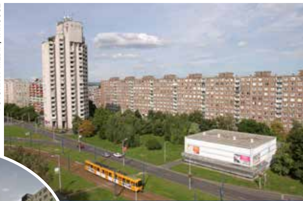
Vonalak találkozása | Járatok minden égtáj felé

Az újpalotai gyorsvillamos kiépítéséről tartottak lakossági tájékoztatót október 7-én a városháza dísztermében. Az