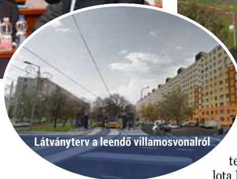
Látványterv a leendő villamosvonalról

önkormányzatot, a Főpolgármesteri Hivatalt és a Budapesti Közlekedési Központot képviselő szakemberek zsúfolásig telt nézőtér előtt ismertették a terveket.