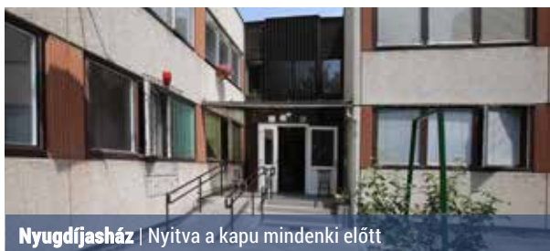
Nyugdíjsház | Nyitva a kapu mindenki előtt

Az Erdőkerülő utca 34. szám alatti Nyugdíjasházban 47 garzon található, ebből jelenleg 10 üres. A lakások 28 négyzetméter alapterületűek (főzőkonyha, fürdőszoba+WC, szoba), összkomfortosak, felújítottak. Minden lakásban víz- és villanyórát szereltek fel. Az épületben szép, tágas társalgó és kellemes, gondozott kert, udvar is van. A ház akadálymentesített, lifttel lehet feljutni az emeletre. Az infrastruktúra kiváló, a közelben bevásárlási lehetőség, orvosi rendelő, gyógyszerár is található. A házban gondnok is dolgozik, aki segíti a lakókat ügyes-bajos dolgaik intézésében. JÁg