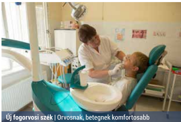
Új fogorvosi szék | Orvosnak, betegnek komfortosabb

A nyáron új vizsgálószéket kapott a Bezsilla Nándor utcai gyermek-fogszabályozás.