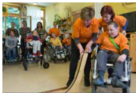
FENO-bowling | Hagyomány lett a verseny