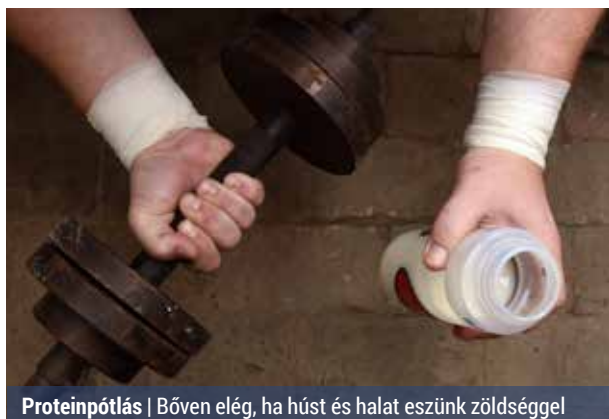
Proteinpótlás | Bőven elég, ha húst és halat eszünk zöldséggel

– Ez a mennyiség általában normál étrend útján is fedezhető. Sőt az átlagos napi fehérjebevitelünk többnyire