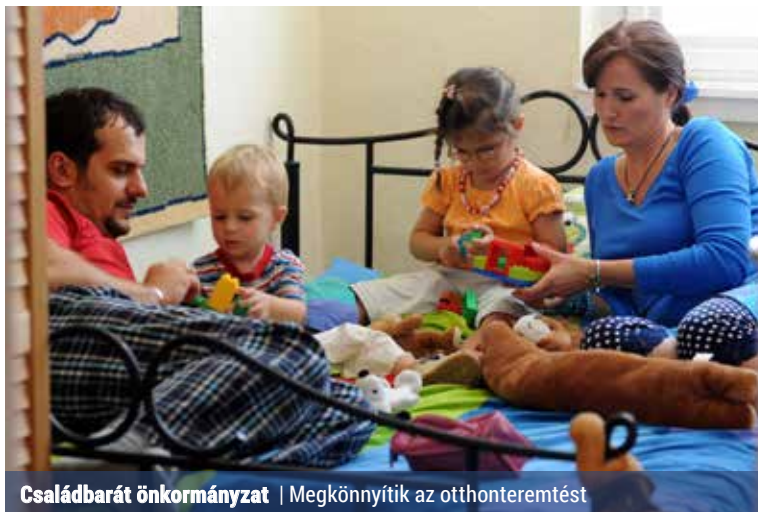
Családbarát önkormányzat | Megkönnyítik az otthonteremtést

Helyi támogatás keretében az első lakás vásárlása és építése esetén 1 000 000, korszerűsítésnél 500 000, egyéb esetekben (például életveszélyes