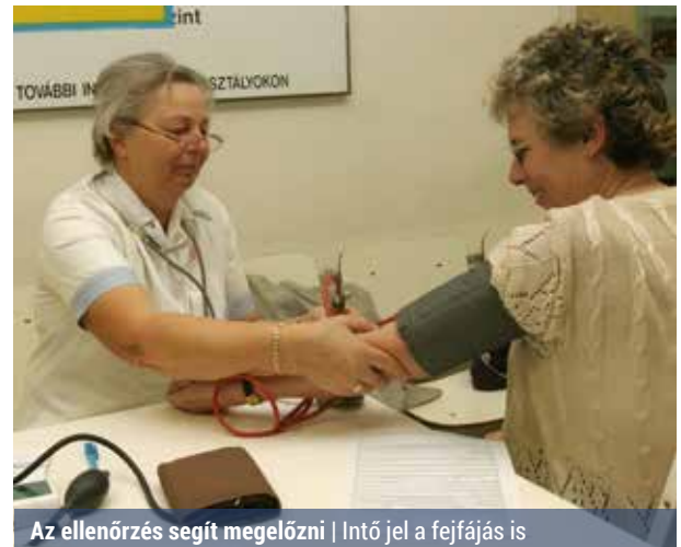
Az ellenőrzés segít megelőzni | Intő jel a fejfájás is