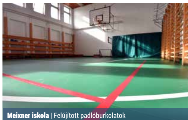
Meixner iskola | Felújított padlóburkolatok