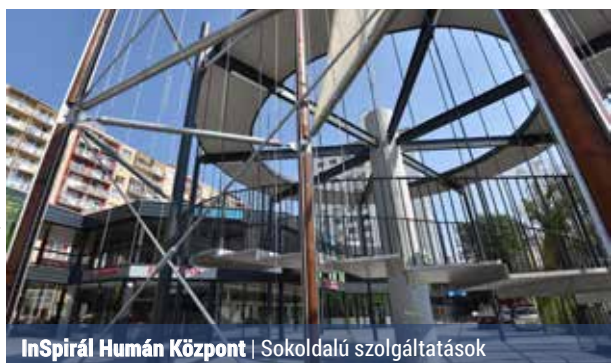
InSpirál Humán Központ | Sokoldalú szolgáltatások