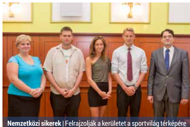
Nemzetközi sikerek | Felrajzolják a kerületet a sportvilág térképére

A XV. Kerületi Önkormányzat év közben is díjazza a kiemelkedő sporteredményeket. Az idei nyár szerencsére bővelkedett ilyen sportsikerekben, így ezúttal több sportolót is elismerésben részesítettek.