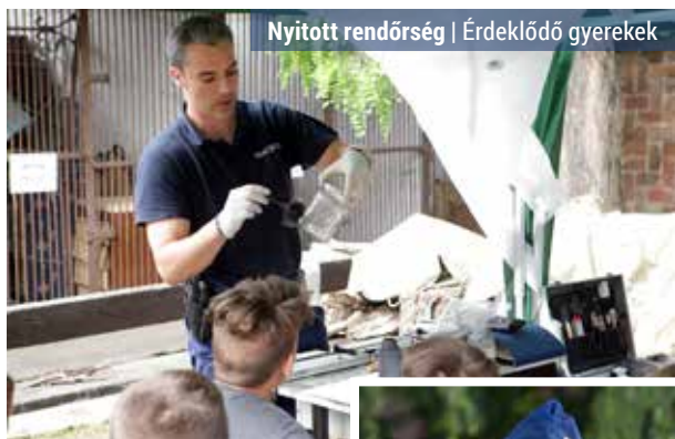
Nyitott rendőrség | Érdeklődő gyerekek

épületében október 2-án dropprevenciós előadással, kutyás bemutatóval, rendőrségi járművek, védőfelszerelések és a fogda megtekintésével várják a felsős diákokat.