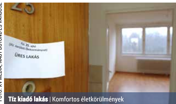
Tíz kiadó lakás | Komfortos életkörülmények

A bekerülés feltétele, hogy ha a kérelmező önkormányzati lakásban bérlő, akkor leadja az önkormányzati lakását, a másik lehetőség szerint pedig a kérelmező egy összegben 3 millió, két együttes kérelmező (házaspár) esetén összesen 4 millió