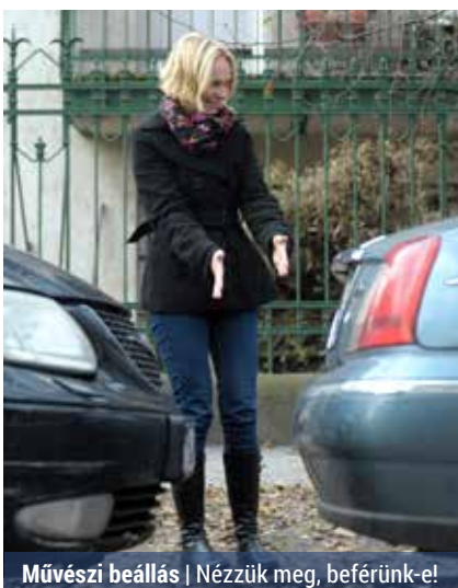
Művészi beállítás | Nézzük meg, beférünk-e!