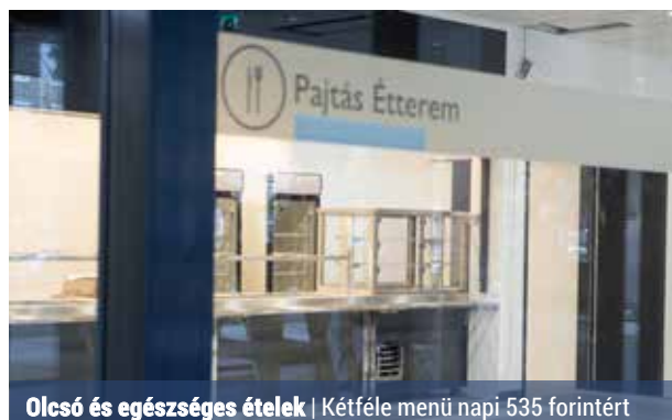
Olcsó és egészséges ételek | Kétféle menü napi 535 forintért

A Pajtás Étterem szeptember 28-án újra megnyitja kapuit az InSpirál házban (Zsókavár utca 24–28.), ahol megújult környezetben, modern technológiával készült, egészséges ételekkel várja a kerületi lakosokat.