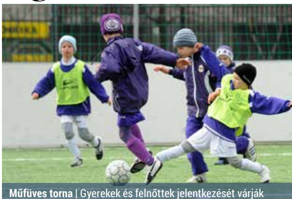
Műfüves torna | Gyerekek és felnőttek jelentkezését várják

A XV. Kerületi Önkormányzat, a kulturális és sportközpont, valamint a REAC Sportiskola Sport Egyesület szeptember 26-án reggel 9 órától rendez meg a II. Amatőr Műfüves Kispályás Labdarúgó Villámturnát.