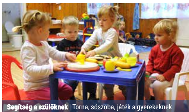
Segítség a szülőknek | Torna, sószoza, játék a gyerekeknek

A XV. Kerületi Egyesített Bölcsődék több olyan szolgáltatást is bevezetett, amelyekkel azoknak a családoknak szeretnének segítséget nyújtani, amelyek egyébként nem veszik igénybe a bölcsődei ellátást.