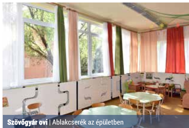
Szövőgyár óvó | Ablakcserék az épületben

A három rákospalotai iskola felújítási munkái mellett több más intézményben is végeztettek rekonstrukciót a Gazdasági Működési Központ (GMK).