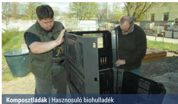
Komposztládák | Hasznosuló biohulladék

Az ültetéshez szükséges eszközöket biztosítják, továbbá lesznek szakemberek, akik