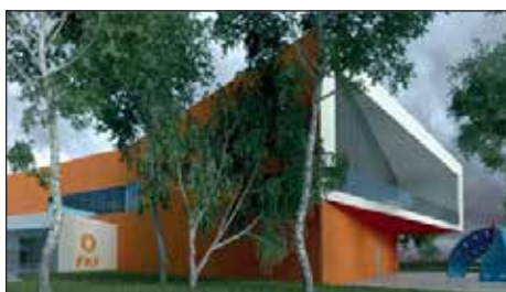
Szemléletformáló és Újrahasználati Központ látványterve

egy-egy új hulladékudvar, újrahasználati központ létesül, ahol oktatást-nevelést segítő szemléletformáló központ is üzemel majd.