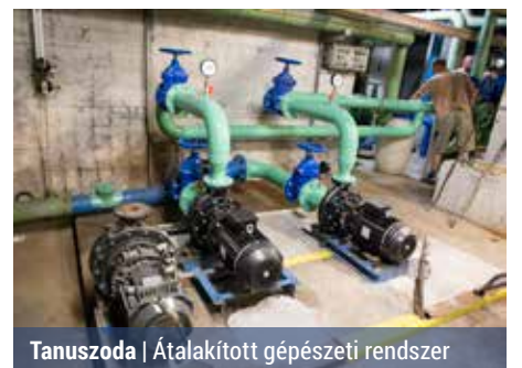
Tanuszoda | Átalakított gépészeti rendszer