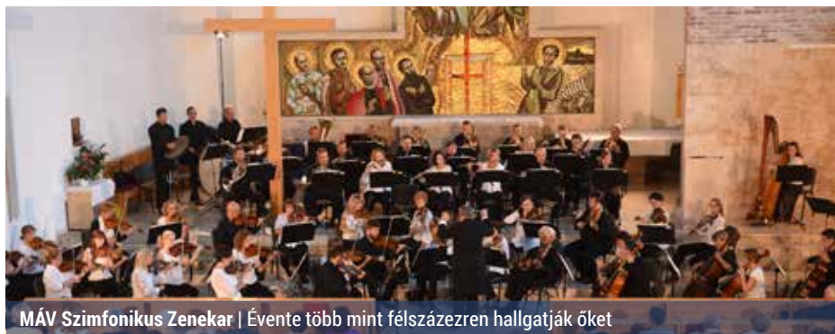
MÁV Szimfonikus Zenekar | Évente több mint félszázezren hallgatják őket