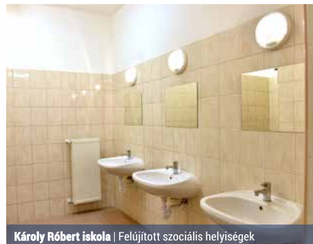
Károly Róbert iskola | Felújított szociális helyiségek

A Károly Róbert iskolában megvalósult a lapos tető korábban elmaradt felületeinek rekonstrukciója, a tornatermi öltözők, mosdók teljes körű felújítása. A létesítményben üzemelő főzőkonyha kiszolgálóhelyiségeinek és a tálalókonyha burkolatainak cseréjével és festésével is végeztek. Tart még a tálalókonyha bútorainak cseréje, és a fűtési szezon előtt elkészül a hőközpont korszerűsítése. (jónás)