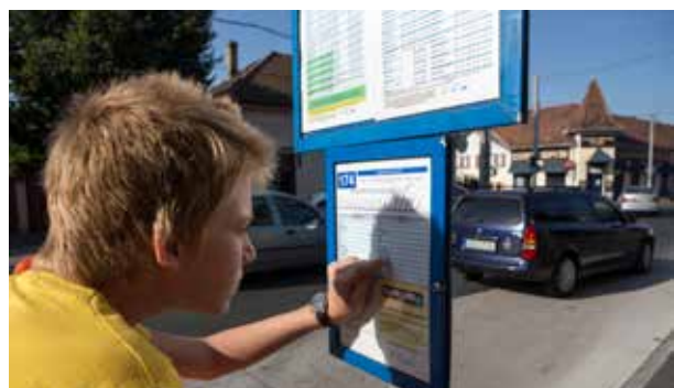
Egyedül a buszmegállóban | Tanítsuk őket biztonságosan utazni!

A tanévkezdéssel a fővárosi tömegközlekedés is új sebességbe kapcsol. A járatok a tanítási időszak idején érvényes menetrend szerint közlekednek, a nyárinál lényegesen sűrűbben – tudatta közleményben a lakosokkal a Budapesti Közlekedési Központ