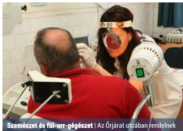
Szemészet és fül-orr-gégészet | Az Őrjárat utcában rendelnek

A Rákos úti szakrendelőben évek óta végzik a rendelők felújítását. Napjainkra már csak két rendelés, a szemészet és a fül-orr-gégészet helyiségei várnak rekonstrukcióra, amelyet a tervek szerint ezen az őszön végeznek el.