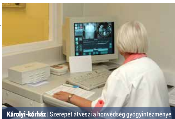
Károlyi-kórház | Szerepét átveszi a honvédség gyógyintézménye

A lakossági fekvőbeteg-beutalási rendet az átalakítás nem befolyásolja, ma-