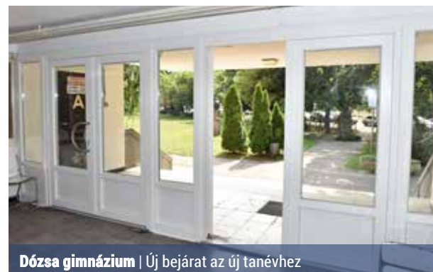
Dózsa gimnázium | Új bejárat az új tanévhez