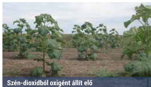
Szén-dioxidból oxigént állít elő