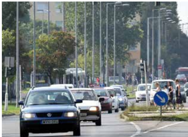
Rövidülő nappalok | Lakott területen is kapcsoljuk fel a fényszórót!

Bár még kellemes az idő, nyakunkon az ősz. Az évszakkal együtt az időjárás viszonyok is szép lassan megváltoznak, amelyek a nyárihoz képest másfajta vezetési stílust kívánnak.