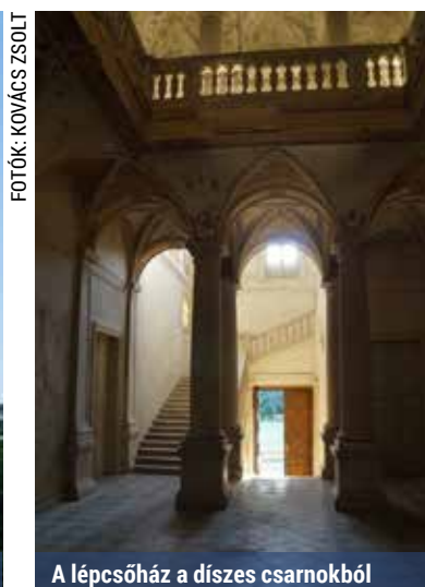
A lépcsőház a díszes csarnokból

alakítottak benne könyvtárat, ebédlőt, szalonokat, biliárdtermet és még egy kápolnára emlékeztető pálmahá-