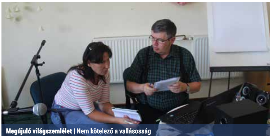
Megújuló világszemlélet | Nem kötelező a vallásosság