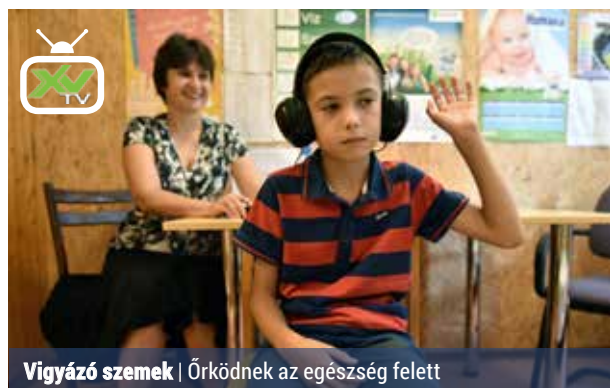
Vigyázó szemek | Őrködnek az egészség felett