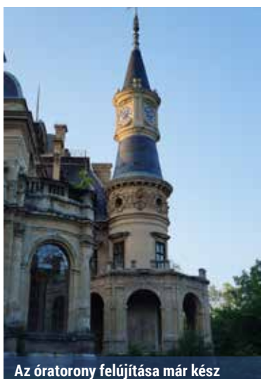
Az óratorony felújítása már kész

A nagy tömegű épület elegánsan filigrán benyomást kelt, a túldíszített, de giccsesnek egyáltalán nem nevezhető stukkós homlokzat még a díszektől idegenkedő látogatót is csodálatra készíti. A romos állapotában is gyönyörű egyemeletes épületbe haldan 98 helyiséget álmodott Ybl. Ki-