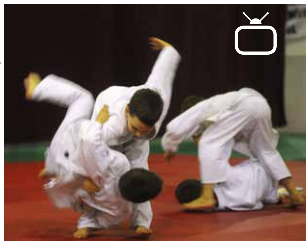
Tanórákon kívüli kötelezettség | Lényeg, hogy szeresse a gyerek

Dr. Vekerdy Tamás neves pszichológus többször nyilatkozott már a különórákkal kapcsolatban. Szerinte a gyerekeknek minél többet kellene a szabadban lenniük, a legideálisabb pedig az volna, ha ebéd után minden