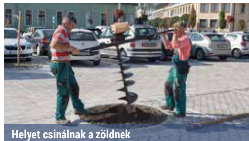
Helyet csinálnak a zöldnek