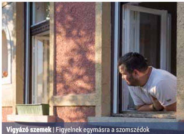
Vigyázó szemek | Figyelnek egymásra a szomszédok

A szemmozgalom lényege, hogy az emberek figyeljenek egymásra és a környezetükre, és ha valami gyanúsát észlelnek, azonnal jelezzék azt az illetékeseknek. A pestúj-