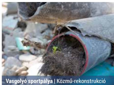
Vasgolyó sportpálya | Közmű-rekonstrukció