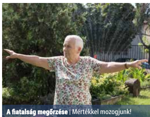
A fiatalság megőrzése | Mértékkel mozogjunk!

Az emberi test alapvetően arra való, hogy terheljük, az izomzat pedig minden életkorban fejleszthető, erősíthető. A terhelhetőség mértéke természetesen életkoronként változik, de a rendszeres edzés még akár 80-90 éves korban is nagyobb erőt, mozgékonyt, hajlékonyságot és erő-