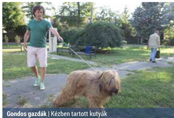
Gondos gazdák | Kézben tartott kutyák

Sokan még mindig nem tudják, hogy az utcákon, tereken kutyát sétáltatni csak pórázzal szabad, szájkosár viszont csak akkor kell, ha tömegközlekedési eszközre szállunk az ebbel vagy ha a kutyát veszélyesnek minősítették.