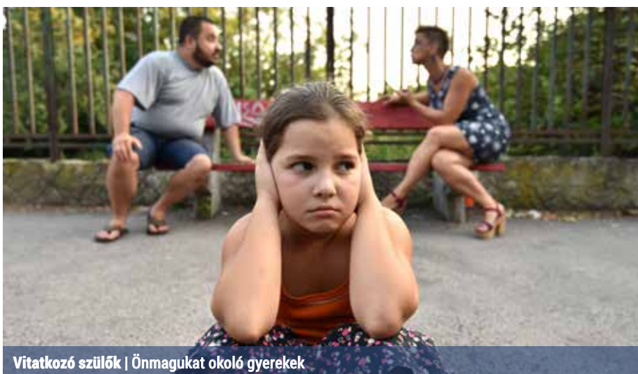
Vitakozó szülők | Önmagukat okoló gyerekek

Ráadásul a válás sok esetben költözéssel is jár, amelynek következménye, hogy új iskolába kerül a gyermek. Mindez azt is jelenti, hogy a felsoroltakon túl a megszokott hely elhagyása, de legfőképpen a kialakult barátságok kényszerű megszűnése pluszként terhelheti őt. Nem hiszik, hogy találnak majd új barátokat, és minden olyan jó lesz, mint volt.