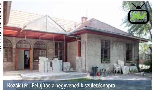
Kozák tér | Felújítás a negyvenedik születésnapra

A Széchenyi úti tanuszodában komoly rekonstrukciós munkák valósultak meg augusztusban. Elvégezték az uszodater szellőzésének felújítását, kitisztították a légtechnikai berendezéseket, elemeket, az elszívó oldalon pedig kicserélték a ventilátorokat. Gépészeti rekonstrukciót is végeztek a szakemberek, melynek keretében lecserélték az ősrégi szivattyúkat. Az uszodaterben digitális kijelző mutatja majd a hitelesített vízhőfokot, és ott is végeztek javításokat. Emellett az előtérben található hajszárítók számát megduplázták, így a nyitástól, szeptember 7-től már egyszerre négy gyerek haját tudják szárítani a kisérek.