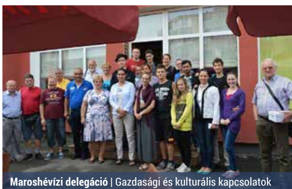
Maroshévízi delegáció | Gazdasági és kulturális kapcsolatok

van. Közöttük olyan külföldi települések találhatók meg, mint az osztrák főváros Bécs 23. kerülete, Liesing, valamint a szintén osztrák Oberwelling, a német főváros Berlin Marzahn-Hellersdorf kerülete, a horvát Donji Kraljevec, a szlovákiai Kassa egyik kerülete, Nad Jazerom, az erdélyi Maroshévíz, míg Kíná-