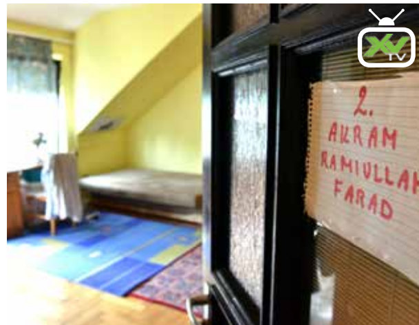
Befogadott árvák | Három külföldi fiatal kapott menedéket

Az Apolló utcai gyermekotthon tíz éve működik a kerületben. Az elmúlt hetekben 12 új külföldi lakó érkezett az intézménybe, mely megosztotta a kerületi közvéleményt. A nyugalom érdekében július végén nyílt napot tartottak a gyermekotthonban, hogy az itt élők megismerkedjenek működésével és nem utolsósorban a menekültek helyzetével.