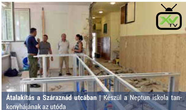
Átalakítás a Száraznád utcában | Készül a Neptun iskola tankonyhájának az utóda