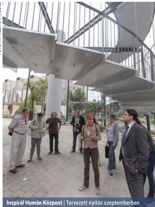
Inspirál Humán Központ | Tervezett nyitás szeptemberben

A tervek szerint ősszel már birtokba vehetik az épületet a szociális szférában dolgozók és a lakosok. A megújuló létesítmény az Inspirál Humán Központ nevet kapta, utalva a ház jellegére. A szolgáltatóház a kerület szociális, közösségi városközpontjává szeretne válni. A Zsókavár rendelőhöz hasonlóan a növényi fallal leválasztott előtér kulturális programoknak adna otthont: térzene, rendezvények, könyvtári kitelepülés interaktív helyszíne lesz.