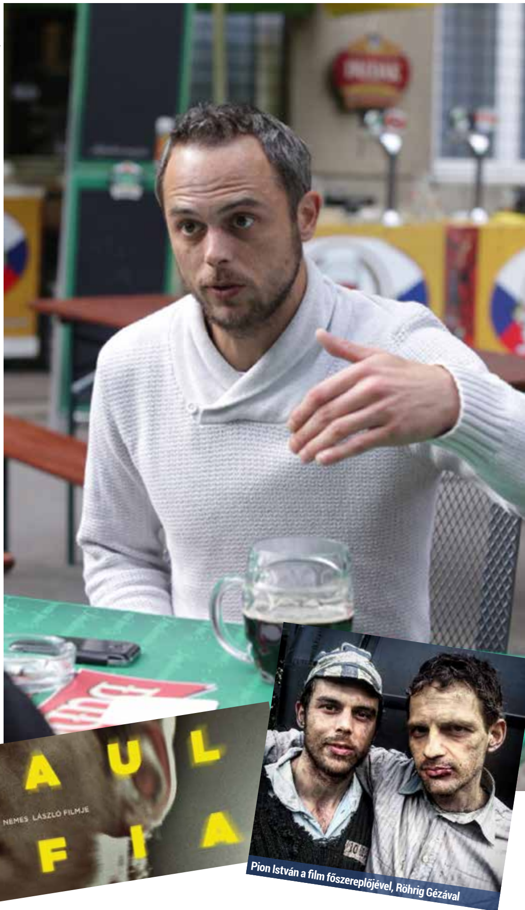
Pion István a film főszereplőjével, Röhrig Gézával