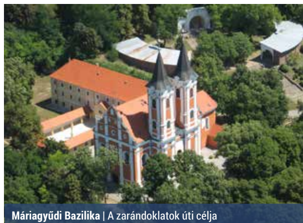
Máriagyúdi Bazilika | A zarándoklatok úti célja