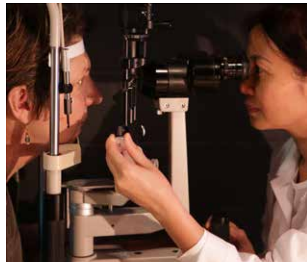
Hetekig tartó várakozás | Átköltöztetés lesz a megoldás