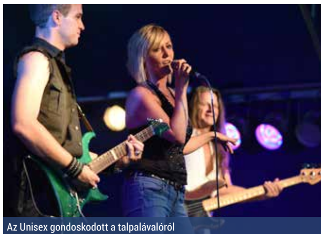
Az Unisex gondoskodott a talpalávalóról