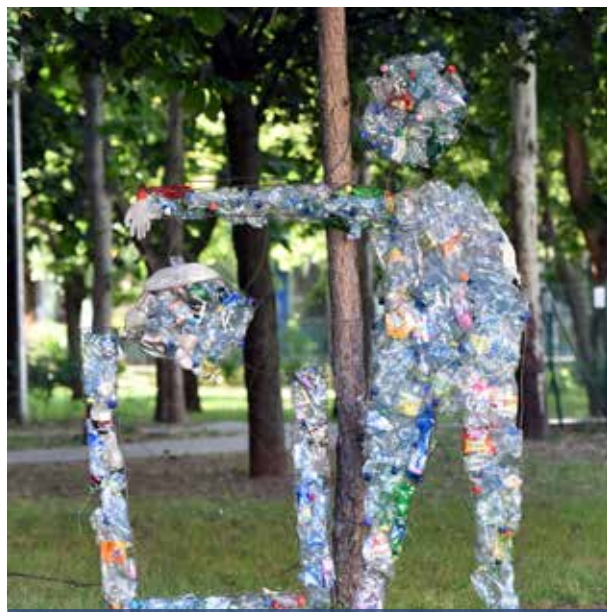
Nemzetközi jelzés | A hulladék a gyűjtőbe való

A Palota-15 Nonprofit Kft. június-százán szedték a szemetet az úpalotai városrész, ezen belül a Zsóka-vár projekt területének megtisztítására és környezetudatos magatartás népszerűsítésére, szemléletformálásra.