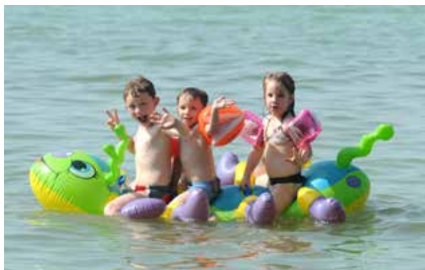
Pancsolás a melegben | Gyerekek csak felügyelettel menjenek a vízbe!

Ahogy melegszik az idő, úgy vágnak egyre többen víz közelébe.