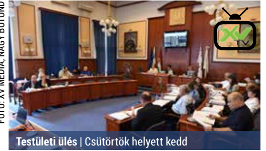
Testületi ülés | Csütörtök helyett kedd

Tárgyaltak a Helyi Esélyegyenlőségi Program felülvizsgálatáról és az ezzel kapcsolatos in-