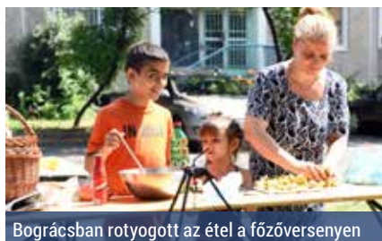
Bográcsban rotyogott az étel a főzőversenyen