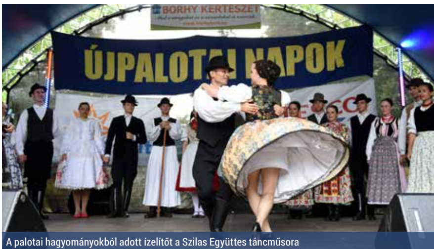
A palotai hagyományokból adott ízelítőt a Szilas Együttes táncműsora