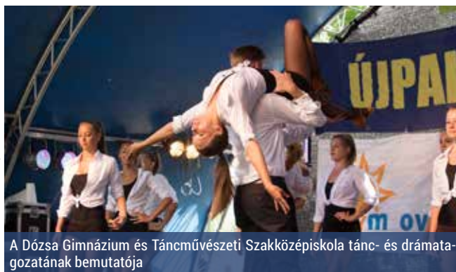
A Dózsa Gimnázium és Táncművészeti Szakközépiskola tánc- és drámatagozatának bemutatója