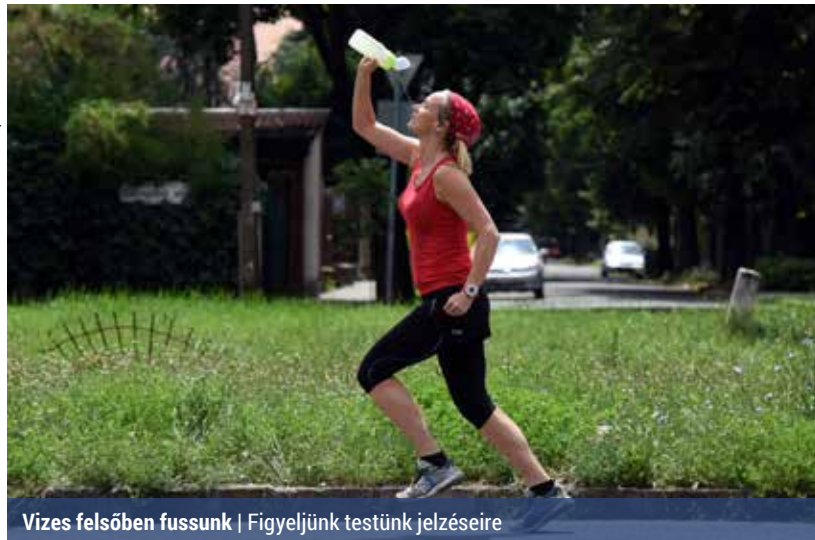
Vizes felsőben fussunk | Figyeljünk testünk jelzéseire

A nagy hőségben célszerű a kora reggeli vagy a késő esti órákra időzíteni az edzést. Akik ezt nem tudják megtenni, gondoskodjanak a megfelelő napvédelemről. Talán nem is gondoljuk, de a bőrünk mellett a haját is érdemes védeni az