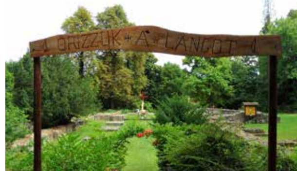
Pálos kolostorrom | Bejárat az épületek falmaradványaihoz

Budaszentlőrinci pálos kolostor romjait a Szépjuhászné gyermekvasúti megállóhoz közel találja az utazó. A pálosok a mai Budakeszi úti teleknél Szent Lőrincnek szentelt kápolnát létesítettek, amelyet egy remete gondjaira bízta, majd 1301 körül viszatértek és elkezdték építeni a kolostorukat. Később, 1308-tól a szentlőrinci monostorban tartották évi káptalanjukat, és ettől kezdve ez lett a rend főkolostora.