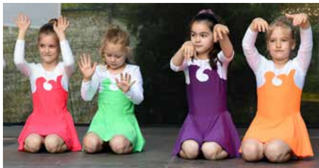
Idén június 12. és 14. között rendezték meg az Újpalotai Napokat kerületünk legfiatalabb részében. A sorban a 23. rendezvényen minden este koncertekkel várták az érdeklődőket. Napközben táncbemutatókkal, főzőversennyel, óriássakkal, bábelőadással, vidámparkkal szórakoztatták a nagyerdeműt. Az utolsó napon tűzijáték jelezte a programsorozat végét, amely csak idén ért véget, jövőre ismét várják a szórakozni vágyókat Újpalota Fő terére.