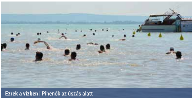
Ezrek a vízben | Pihenők az úszás alatt

A szervezőbizottság úgy döntött, hogy hasonlóan az elmúlt két évhez, idén is az egy hónapnál nem régebbi, Magyarországon kiállított orvosi igazolással lehet nevezni. Ha valaki nem tudja hozni az egy hónapnál nem régebbi orvosi igazolását, a helyszínen is lesz lehetősége az orvosi ellenőrzésre.