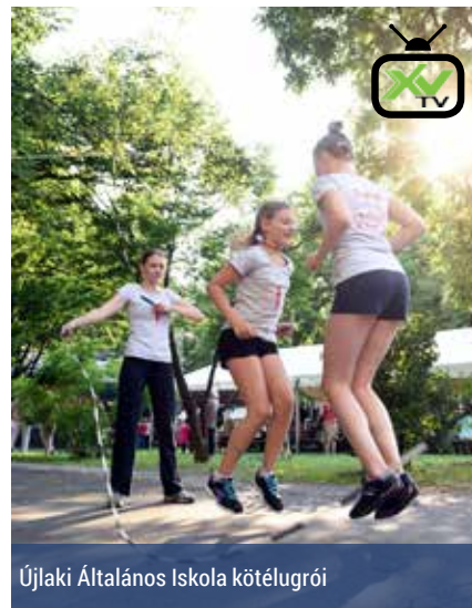
Újlaki Általános Iskola kötélugrói