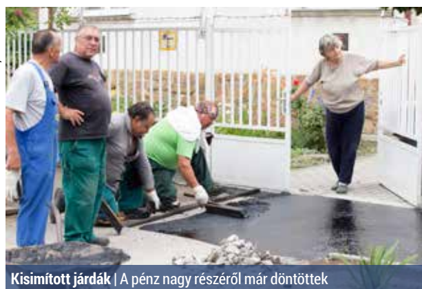
Kisimított járdák | A pénz nagy részéről már döntöttek

– Idén 76 millió forintot különített el erre a célra az önkormányzat, ebből több mint 66 millió forintra már döntés is született. Ez azt jelenti, hogy valószínűleg augusztus végére ez a pályázati forrás kimerül – tudtuk