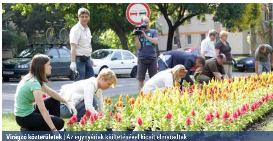
Virágzó közterületek | Az egyháziak kiültetésével kicsit elmaradtak

1 millió négyzetméterre tehető a zöldfelület nagysága, amelynek gondozását, így a Szerencs utcai virágo-