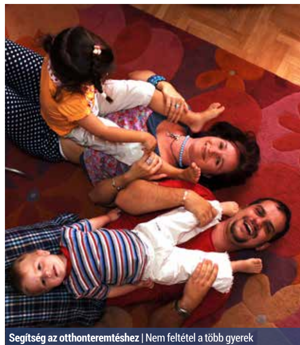
Segítség az otthonteremtéshez | Nem feltétel a több gyerek

Új lakástámogatási rendszert vezet be július 1-jétől a kormány, a családi otthonteremtési kedvezményt (csok). A támogatás már igényelhető a bankfiókokban.