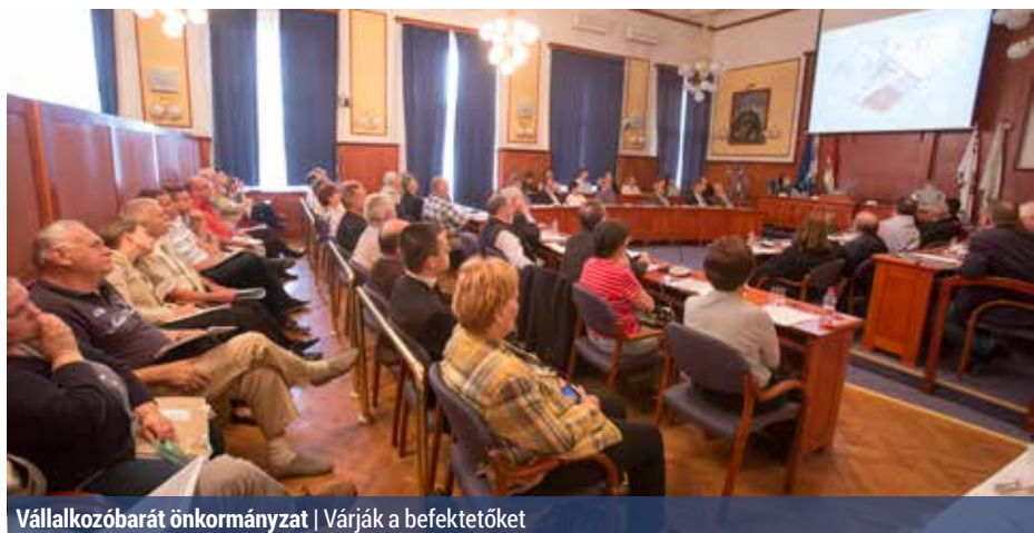
Vállalkozóbarát önkormányzat | Várják a befektetőket

A márciusi bemutatkozó találkozás után június 23-án ismét eszmecesterre hívták az önkormányzat vezetői a kerületi kis- és nagyvállalkozókat. A rendezvény célja a vállalkozói kedv erősítése, egyfajta ötletbörze, a munkaerőpiac bővítése és a kölcsönös bizalom kiépítése volt.