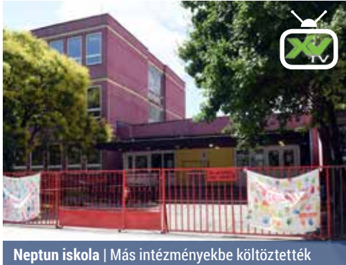
Neptun iskola | Más intézményekbe költöztették