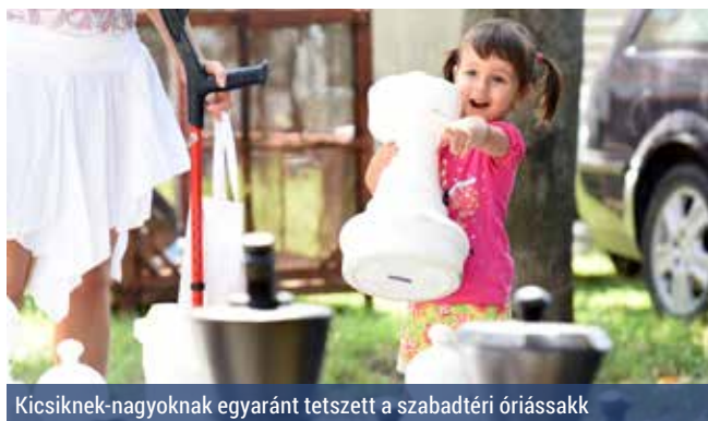
Kicsiknek-nagyoknak egyaránt tetszett a szabadtéri óriássakk