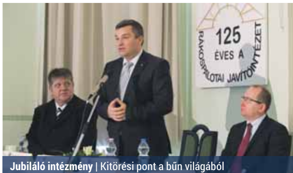
Jubiláló intézmény | Kitérés pont a bűn világából

A szakemberek november 24-én tanácskozássra gyűltek össze. A hatékony és professzionális munka megalapozását segítő előadások mellett a nővendékek műsorral elevenítették fel az intézmény elmúlt évtizedeit. Rákospalotán 1890-ben alapították az ország első állami leányjavító intézetét. Hét- és húszéves közötti, bűncselekményt elkövetett vagy züllésnek indult lányokat neveltek e falak között bírói utasításra, illetve szülői kérésre. A nevelést keresztény szellemben, családokban végezték. Az eltelt 125 év alatt azonban sok