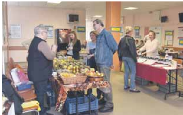
Rákos úti Szakrendelő | Cél az egészségmegőrzés

sit és a légzésfunkciót, illetve az érszűkület-vizsgálatot, továbbá szó esett az egészséges táplálkozásról, és egészséges ételeket is kóstolhattak az érdeklődők.