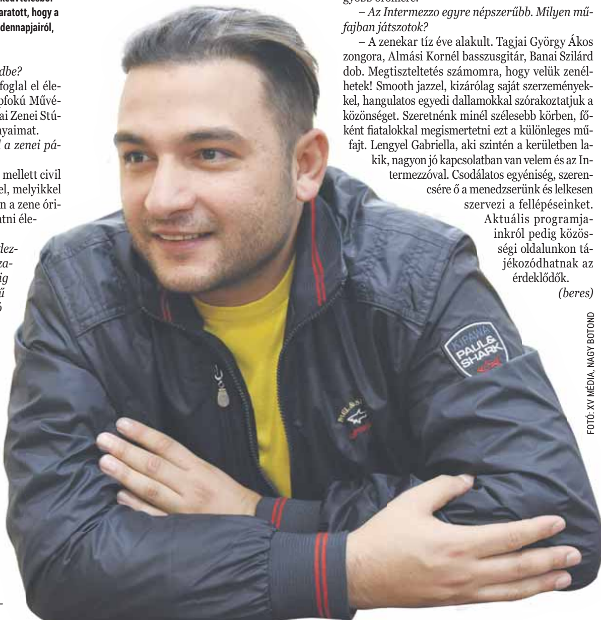
FOTÓ: XV MÉDIA, NAGY BOTOND