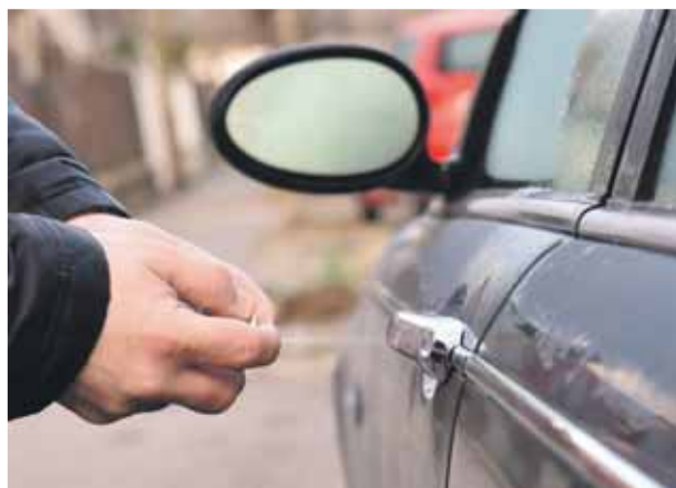
Használjunk olajozóspray-t! | Fontos a zárak és az ajtók ápolása

A téli időjárás – ha nem gondoskodunk a megfelelő védelemről – autónkat is megviselheti, s okozhat benne, rajta akár visszafordíthatatlan károkat is. Éppen ezért mindenképpen érdemes elvégezni bizonyos munkákat még a havas, latyakos idő beállta előtt.