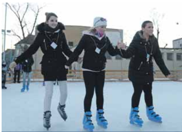
Czabán és Száraznád iskola | Decemberben nyitnak a pályák

A jégpályák használata a korábbi évekhez hasonló lesz: reggel 8 és délután 4 óra között az oktatási intézmények használják majd úgy, hogy reggel 8 és délután 1 óra