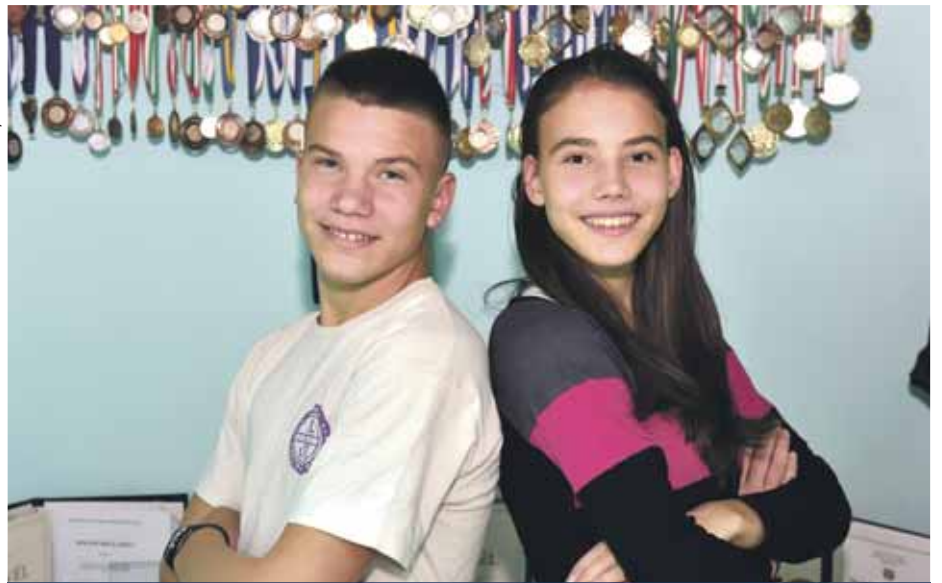
A tehetséges Mógorok | Az egyik focizik, a másik fut

Az, hogy Bogiból közép-távfutó lett, egy versenyen