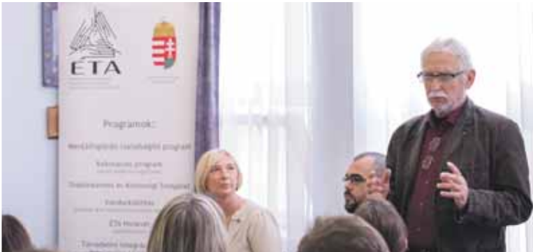
Esélyegyenlőség a gyakorlatban | Integrálódás a társadalomba

A fogyatékossgal élő embereket segítő szociális rendszer számos eleme az esélyegyenlőség megteremtésének fontos mozgatórugója lett társadalmunknak, azonban gyakorlatban még mindig nehezen valósul meg az egyenrangú életvitel.