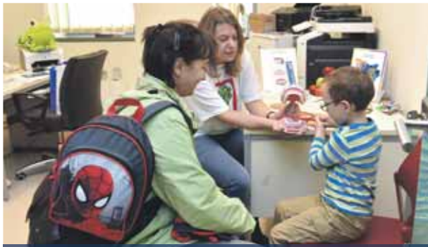
Zsókavár rendelő | Egészségre nevelés már kicsi korban

A Rákos úti Szakrendelőben több mint tíz éve hagyomány, hogy évi egy vagy két alkalommal egészségnapot szerveznek a kerületi lakosoknak. A rendezvényt tavasszal és ősszel is megrendezik, és az utóbbi években a programhoz csatlakozott a Zsókavár utcai rendelő is, ahol a gyerekeknek tartanak szűréseket.