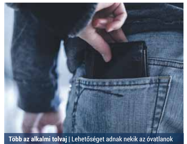
Több az alkalmi tolvaj | Lehetőséget adnak nekik az óvatlanok