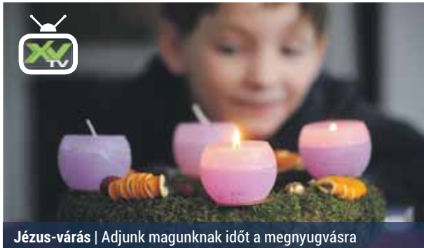
Jézus-várás | Adjunk magunknak időt a megnyugvásra

Az advent november 29-én, vasárnap kezdődött, amely – a keresztény hagyomány szerint – az új egyházi év és a karácsonyra való felkészülés időszaka. Maga az elnevezés a latin „adventus”, azaz „eljövetel” szóból származik. Az emberiség 4 ezer évig várta Jézus eljövételét, ezt szimbolizálja az adventi koszorú 4 gyertyája, melyek közül a karácsonyig hátralévő vasárnapokon mindig egy-