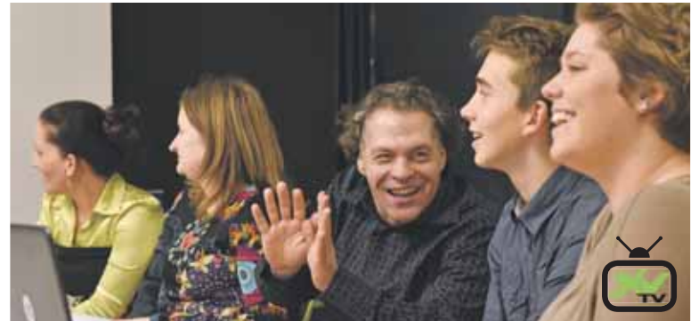
Nemzedékek eszmecseréje | Tematikus fórumok

Az igazgatóhelyettes többek között arra is kitért, hogy a megváltozott munkaképességű emberek éppúgy a társadalom aktív részesei kívánnak lenni, mint bárki más. Ezt a törekvésüket azonban egyelőre számos tényező befolyásolja. Meg kell ismerni a hátrányos helyzetűeket érintő kérdéseket, és meg kell oldani azokat a problémákat, melyek abban akadályozzák őket, hogy a mindennapi életben teljes jogú emberként élhessenek. (beres)