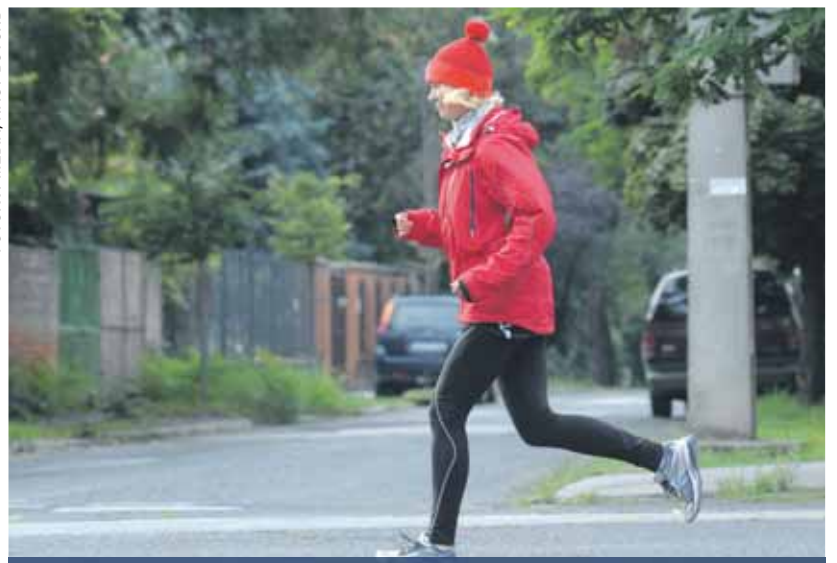
Edzés a rosszkedv ellenszere | Csokievés helyett fussunk!

A mozgás során ugyanis boldogsághormont – endorfint – szabadít fel szervezetünk (amelynek termelődését egyébként például a csokoládéézés is serkenti). Vegyünk hát erőt magunkon, és kezdjünk hozzá az edzéshez, készüljünk fel a rendszeres testmozgásra.