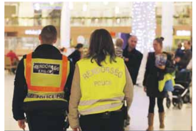
Vigyáznak a rendre | A vásárlók is felelősek az értékeikért

Advent idején kezdődik a felkészülés az év legerősebb ünnepére, a karácsonyra. Az egyre fokozódó ünnepi hangulatban az emberek sokszor megfelelnek a legalapvetőbb vagonbiztonsági szabályokról.