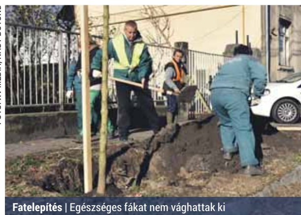
Fatelepités | Egészséges fákat nem vághattak ki