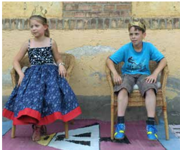
Pünkösdi királyság a Meixner suliban

A néphit szerint, ha pünkösdkor szép az idő, jó lesz a borteremés. Egyes vidékeken ma is él a pünkösdi királyválasztás szokása, ilyenkor a falu legényei különböző ügyességi próbákon mérték