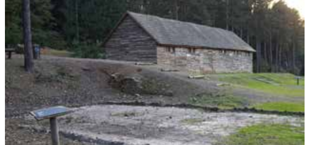
A rekesi munkatábor rekonstruált barakkja

a kommunizmus áldozatainak emléknapjává nyilvánította. 1947-ben ezen a napon Kovács Bélát, a Független Kisgazdapárt főtákarát a megszállt szovjet hatóságok jogellenesen letartóztatták, majd a Szovjetunióba hurcolták. A mentelmi jogától megfosztott képviselő nyolc évet töltött börtönökben és munkatáborokban. Kovács Béla 1959-ben, 51 évesen halt meg. Letartóztatása az első átlomása volt annak az eltervezett folyamatnak, amely során a kommunista párt az ellen-